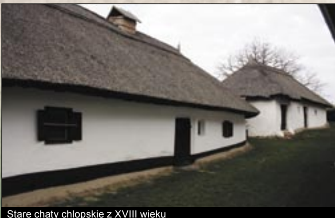
Stare chaty chłopskie z XVIII wieku

Wioska jest jedną z trzech charakterystycznych matyó osad (Mezőkövesd, Szentistván, Tard) (matyó: węgierska grupa etniczna