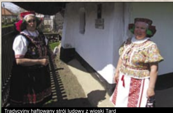
Tradycyjny haftowany strój ludowy z wioski Tard