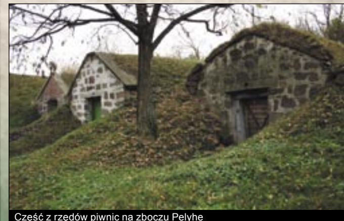
Część z rzędów piwnic na zboczu Pelyhe

Na północ od Tardu znajdujące się obszary łąkowe (Dolina Bála, zbocze Meggyes) zostały objęte ochroną pod nazwą Pastwiska Tard (Tardi legelő). Obszar będący pod ochroną przyrody ma około 280 hektarów. Miejsce to styka się bezpośrednio z Doliną Kamień (Kő-völgy) Parku Narodowego będącą pod ochroną. Głównym celem ochrony obszaru