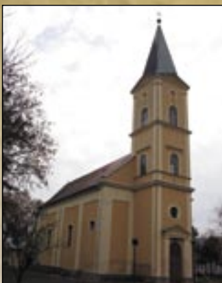
Kościół rzymsko-katolicki wioski Tard

T ard leży 22 km na wschód od Egeru u podnóża Gór Bukowych. Pierwsze wzmianki o osadzie pochodzą z roku 1220 pod nazwą Thord w Regestrum Váradí (w Protokóle Váradí), ale prawdopodobnie miejsce to było już wcześniej zamieszkałe o czym świadczą odkrycia archeologiczne na wzgórzu Tatarów pochodzące z okresu wczesnego brązu należące do kultury Hatvan. Tard w XIX wieku należał do Diósgyőr, później do zamku Cserép i w obydwu