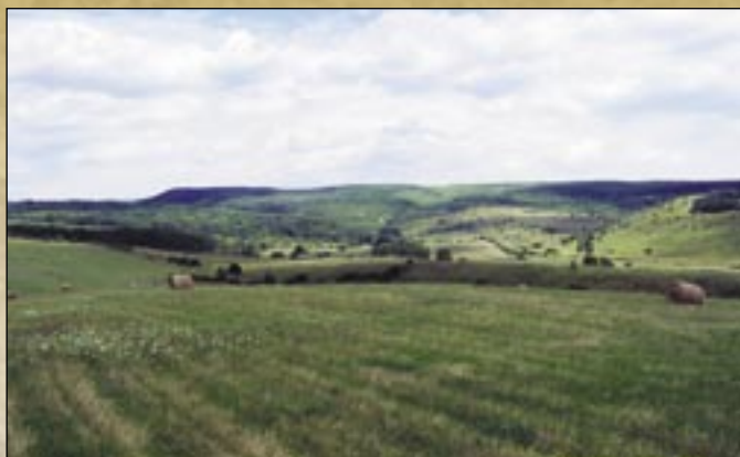
Pastwiska Tard pod ochroną przyrody

w okolicach Mezőkövesd) chociaż od dwóch wcześniej wymienionych pod wieloma względami różni się w kulturze i bardzo dużo indywidualnych cech nosi w sobie. Teren ten sławny jest z wyrafinowanego haftu i ciekawych budowlanych tradycji. Prowincjonalne domy zachowane w ich oryginalnym umeblowanym stanie, pokryte strzechą pielęgnują wspomnienia dawno minionego życia chłopskiego, obok których w sąsiedztwie działa ośrodek imprez kultywujących tujejsze tradycje. Domy będące pod ochroną zażytków przy ulicy Béke pod num. 55. i 57. ukazują nam architekturę z XVIII wieku, życie ludowe, sprzęty gospodarstwa domowego i stroje ludowe regionu matyó.