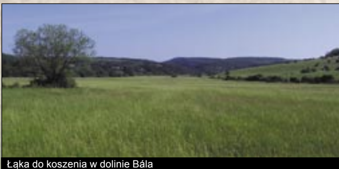
Łąka do koszenia w dolinie Bála

Godny jest wspomnienia kościół rzymsko-katolicki wioski (p.w. Św. Piotra i apostoła Pawła) z należącą do niego relikwią z XVII wieku. U podnóża wzgórz, które w koło opasają Tard na wielu rzędach piwnic można degustować miejscowe specjały winne w bogato urządzonych piwnicach.