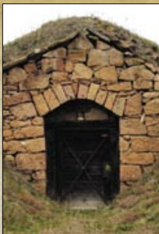
Piwnica w dolinie Aleksandra (Sándor)

jest znajdujące się na nim bagno, łąki i wegetacja lessu (trawniki lessu, krzewy, fragmenty zagajnika lessu dębowego) czy też utrzymanie siedlisk flory i elementów fauny. Majątek należący do zarządzania Parku Narodowego poddawany jest tradycyjnym wypasom owiec, podczas gdy okolice doliny z łąkami bagien są regularnie koszone, żeby utrzymać ich naturalny stan. Swoiste znaczenie mają rozległe sady owocowe na Zbocza Piekła (Pokol-oldal), które to miejsce stwarza korzystne warunki do uprawy wielu cennych gatunków owoców.