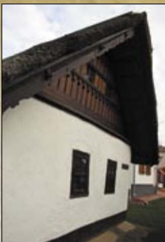
Ozdobiony szczyt domu regionalnego w wiosce Tard