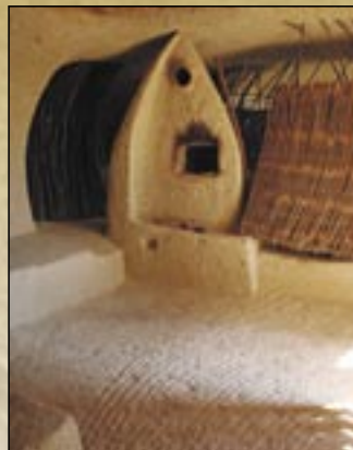
Część Dziury Pocema

Większość domów mieszkalnych osady, będących pod ochroną zabytków strzeże tradycje lokalnego budownictwa ludowego: przy