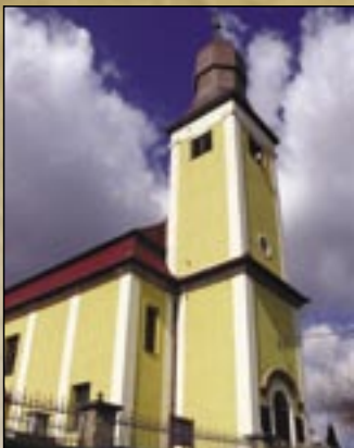
Kościół Kalwiński w Noszvaj