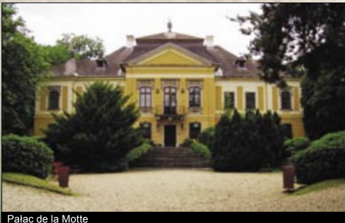
Pałac de la Motte