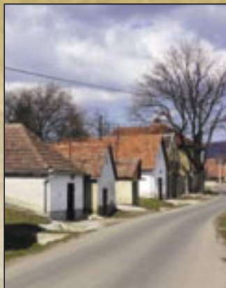
Rząd piwnic w Noszvaj

w którym możemy podziwiać nadzwyczajne gatunki drzew i ozdobne krzewy, np: cis, dąb szypułkowy „Fastigiata” i magnolia.