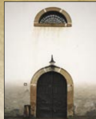
Wejście do starego pomieszczenia tloczenia wina

Według pisemnych dokumentów w osadzie już w roku 1248 stał jeden mały kościół w stylu romańskim, który w drugiej połowie XVI wieku stał się kościołem kalwińskim. Niezależny kościół działał tu już od roku 1596. Dawny kościół z czasów Árpáda (wódz węgierski, protoplasta dynastii Arpadów) w roku 1828 rozebrano i na jego miejsce zbudowano nowy, szerszy i dłuższy kościół z wykorzystaniem starych elementów (nowy kalwiński kościół jest pod ochroną zabytków). Malowany sufit drewniano-kasetonowy starego kościoła, pochodzący z roku 1734 zalicza się do unikatów w historii sztuki, można go zobaczyć w Egerze w Gotyckim Pałacu Muzeum Zamku imienia Dobó István (dowódca obrony Egeru podczas oblężenia tureckiego w roku