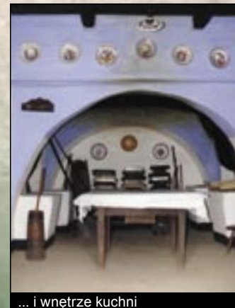
... i wewnątrz kuchni