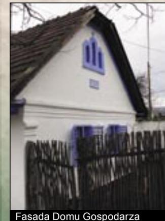
Fasada Domu Gospodarza