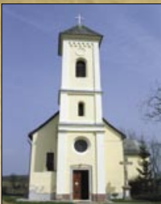
Kościół rzymsko-katolicki wioski Kács