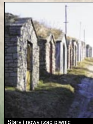
Stary i nowy rząd piwnic

W tufie riolitowej drażone kamienne obory, mieszkania jaskiniowe, kryjówki, piwnice i kamienne ule są szczególną naturalną wartością historii kultury wioski. W Kácsu na południowo-zachodnim zboczu Góry Zamkowej (Várhegy) w tufie riolitowej wykuto kilka ogromnych