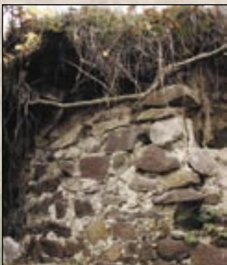
Resztki murów zamku Kács

Na północ od osady znajduje się Pustelnia (Remetelak) , wydrążone w tufie mieszkanie jaskiniowe. 3 nisze kamiennego ula i 3 ślady niszy możemy znaleźć na zachodniej części łańcucha szczytu Kozi Kamień (Kecskekő) , który wznosi się we wschodniej granicy wioski. Wgłębienie znajdziemy żłobione przez naturę w wapieniu z okresu nisko triasowego potem z okresu eoceńskiego nad wąwozem doliny Małego Wąwoza (Kis-szoros) znajdującej się na północnej granicy wioski Kács. Wgłębienie Zsendice (Zsendice-lyuk) otwiera się jako studnia o średnicy 5-6 metrów, które ma 17 metrów głęboką jamę będącą największą jaskinią Gór Bukowych uformowaną w wapieniu eoceńskim.