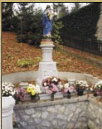
Źródło Marii w centrum wioski

Kács leży 44 km na wschód od Egeru na południowej części łańcucha Gór Bukowych w dolinie potoku Kács. Pierwsze wzmianki o wiosce pod nazwą Kach były w dyplomie króla węgierskiego IV Béla w roku 1248. Wioska ta jest osadą z epoki Árpáda, która mając przychylne położenie służyła do zakwaterowania Węgrów w czasach węgierskiego podboju. Według Anonymusa (dawny węgierski pisarz historii) w czasie podboju Árpád (wódz węgierski, protoplasta dynastii Arpadów) tutaj dał własność zakwaterowania dla przywódcy Ócsád, i potem jego syn Órsúr kazał wybudować zamek przy źródle potoku Kácsa. Tak ród Órsúr jest najstarszym właścicielem rejonu (historyczny komitat Borsod). Już tylko ruiny zamku stoją, który prawdopodobnie był z XIII wieku. Te ruiny prawdopodobnie mogły być czworokątna wieżą mieszkająca w kole otoczoną rowami napełnionymi wodą i przypuszczalnie używano jej od drugiej połowy XII wieku do początku XIV wieku. Zamek wpada w granice Tibolddaróc (pobliska wioska), ale w literaturze występuje jako zamek Kács. O klasztorze wioski, któ-