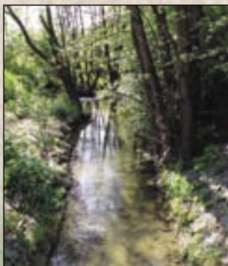
Lasek wzdłuż potoku Kács

Punkt informacyjny pod nazwą „Bukkaljai Kő-út” (Droga Kamienia u podnóża Gór Bukowych) – Eger, w Fellner-tömbelső (w podwórzu bloku Fellner)