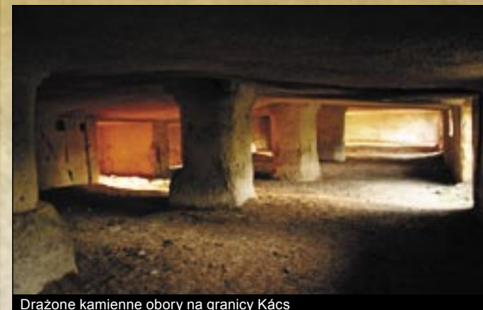
Drażone kamienne obory na granicy Kács

dostarczana jest woda wytryskująca z pod podłogi. Nisze do spania zakonników przemieniono na miejsca kąpeli nasiadowej. Wyciąg leczniczej wody wytwarzano w 500 litrowym czerwono miedzianym kotle w oddzielnie stojącym budynku. Kąpielisko dzisiaj nie funkcjonuje.