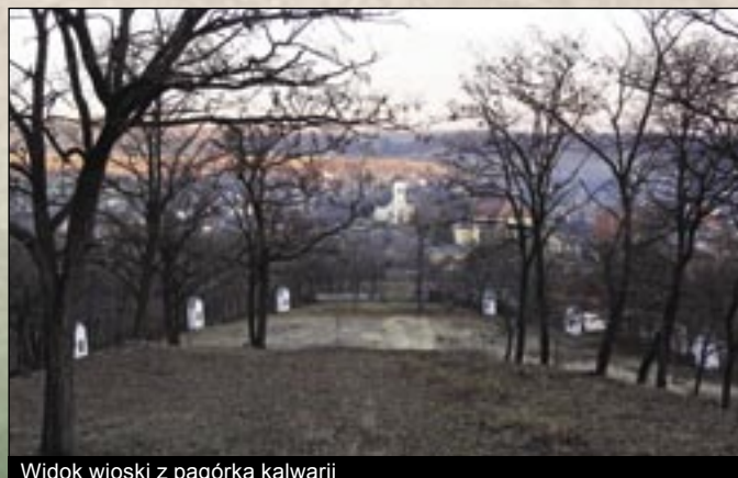
Widok wioski z pagórka kalwarii

14 źródeł o zimnej i letniej wodzie (14–24 °C) potoku Kács używano od dawien dawna. Przy nich osiedliło się i opactwo. Zakonnicy Benedyktyni wnieśli budynek, w którym produkowali leczniczą wodę z ziół znajdujących się na tym terenie i z kwasowęglową wodą źródeł. Tym leczyli pacjentów. Kąpielisko Kács-Tapolca założyli w roku 1431. Budynek barokowy kąpieliska (dawny klasztor benedyktyński) stoi do dziś, w nim znajduje się mały basen 4x4 metrowy, do którego