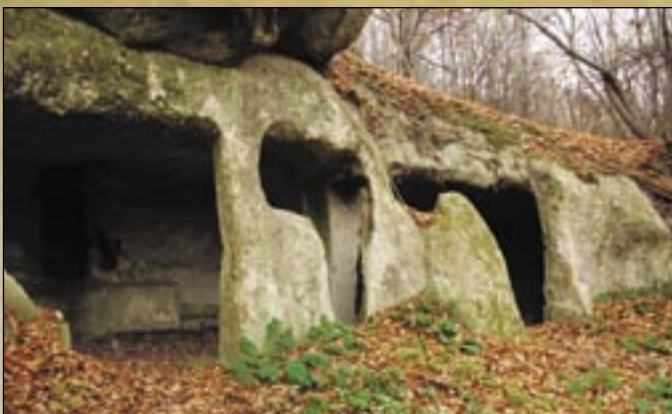
Mieszkanie jaskiniowe na zboczu Góry Zamkowej (Vár-hegy)

obór kamiennych składających się z kilku pomieszczeń a słupy ich wyrzeźbiono. Miejscowi pasterze tutaj trzymali wiejskie stada.