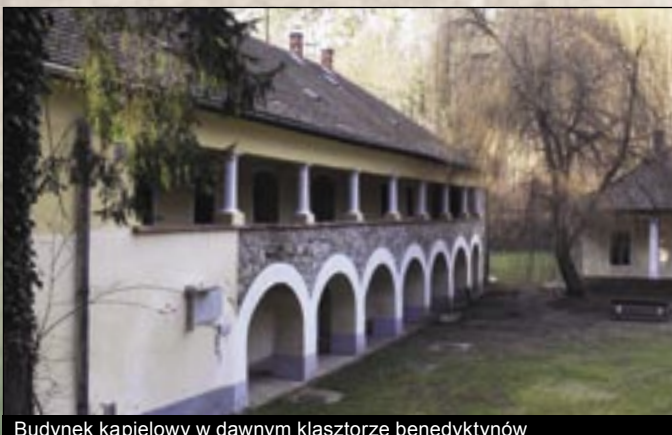
Budynek kąpielowy w dawnym klasztorze benedyktynów

Kács leży 44 km na wschód od Egeru na południowej części łańcucha Gór Bukowych w dolinie potoku Kács. Pierwsze wzmianki o wiosce pod nazwą Kach były w dyplomie króla węgierskiego IV Béla w roku 1248. Wioska ta jest osadą z epoki Árpáda, która mając przychylne położenie służyła do zakwaterowania Węgrów w czasach węgierskiego podboju. Według Anonymusa (dawny węgierski pisarz historii) w czasie podboju Árpád (wódz węgierski, protoplasta dynastii Arpadów) tutaj dał własność zakwaterowania dla przywódcy Ócsád, i potem jego syn Órsúr kazał wybudować zamek przy źródle potoku Kácsa. Tak ród Órsúr jest najstarszym właścicielem rejonu (historyczny komitat Borsod). Już tylko ruiny zamku stoją, który prawdopodobnie był z XIII wieku. Te ruiny prawdopodobnie mogły być czworokątna wieżą mieszkająca w kole otoczoną rowami napełnionymi wodą i przypuszczalnie używano jej od drugiej połowy XII wieku do początku XIV wieku. Zamek wpada w granice Tibolddaróc (pobliska wioska), ale w literaturze występuje jako zamek Kács. O klasztorze wioski, któ-