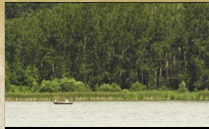
Az Egerszalóki-tó kedvelt horgászhely

van vájva, amely bejárata felett egy kaptárfülke árválkodik. A falu több részén a domboldalakon riolittufába vágott barlanglakások vannak. A barlangházakat a XIX. század elején nagyrészt szegények lakták. Ezek az 1980-as évek végére lakatlanná váltak, helyenként kamráknak, borospincéknek még ma is használják. A Sáfrány utca összefüggő barlangházai szépen illeszkednek a Hőforráshoz vezető turistaút attraktív képződményeibe.