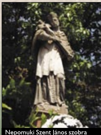
Nepomuki Szent János szobra

A település melletti Maklyán várat (másképpen: Maklány) feltehetően a Debrői Maklyán család építette a XIII. század második felében. 1435-ben már csak mint rom szerepel az iratokban, 1509-ben pedig már csak a vár helye. A vár közelében lévő kőbányából hordatta saját építkezéseihez az építőkövet az egri káptalan. A 214 méter magas, kerek „kőpiramison” nyugvó egykori vár helyétől délre emelkedő Menyecske-hegyen , 2 sziklavonulaton 4 darab kaptárköfülke ismert. A bükkaljai kőértékek szép példái a Maklyán vár közelében található tufába vájt juhhodály illetve a Kőasszony (Leánykő) nevű riolittufa sziklakúp, amibe bújószerű helyiséget faragtak. Ettől délre van egy fülke nélküli magányos kúp is, amit a helyi lakosok Kőbojtárnak neveznek. A település déli részén a demjéni út melletti pincesor felett, az útról is jól láthatóan, az Öreg-hegyen emelkedő tufatömbbe szintén egy bújó ( Betyárbújó )