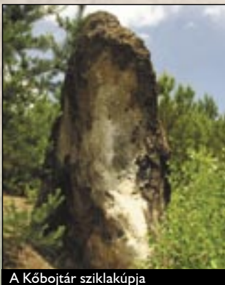
A Kőbojtár sziklakúpja

A település fő vonzereje a község déli részén a föld mélyéből feltörő hévizforrás . A 410 m mélyről feltörő víz 65–68 °C-os,