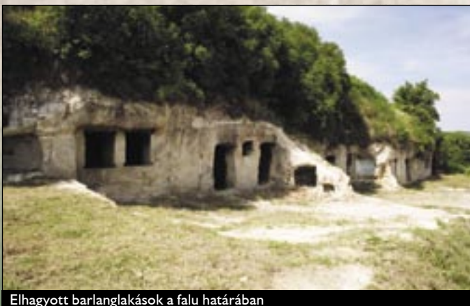
Elhagyott barlanglakások a falu határában

Egerszalók Egertől 6 km-re nyugatra a Mátra és a Bükk-hegység között a Laskó-patak völgyében fekszik. A település már a honfoglalás óta lakott, a Szalók nemzetség ősi birtoka volt. Első okleveles említése 1248-ban történik, „terra-Zolouk” névalakban. A XVI. század elején Egerszalók legnagyobb része az egri káptalan birtokába került. Eger 1552. évi ostroma idején a törökök elpusztították, de rövidesen újra benépesült. 1586-ban a török a káptalan jobbágyaitól, a Belényi és Szalóky köznemes családok jobbágyaitól is súlyos fejadót, illetve bordézmát szedett, ennek folytán a falu egyre inkább elnéptelenedett. 1687-ben, Eger visszavétele után, a szalóki jobbágyok a szabad királyi városi rangra emelt Eger városába költöztek, hogy ott az adóterhektől mentesüljenek, de az uralkodó parancsára a várkatonák az ott összegyűlő jobbágyokat kiűzték és visszavitték földesuraik birtokára. A falu így 1694 körül visszakapta a lakóinak egy részét, de csak egy évtizedre, mert a kuruc időkben újra elnéptelenedett. A káptalan 1731. június 4-én kiadott telepítési szerződésével 35 sváb és német jobbágy családot telepített Szalókra. A XVIII. század közepétől magyar jobbágyok tömegesen költöztek ide, a falu népe előbb kétnyelvű, később magyarrá lett.