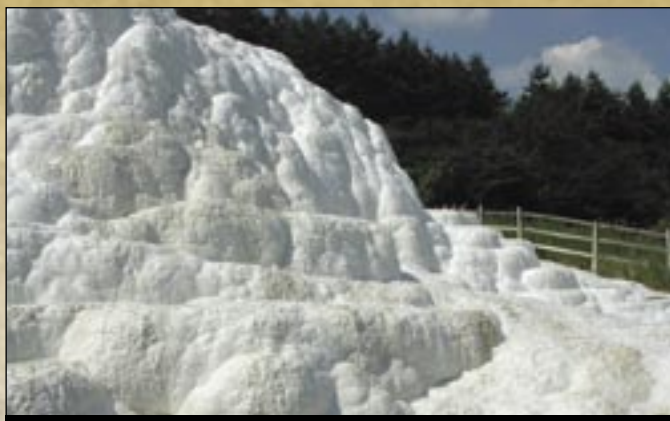
Mésztufa domb a szalóki hőforrásnál

A település melletti Maklyán várat (másképpen: Maklány) feltehetően a Debrői Maklyán család építette a XIII. század második felében. 1435-ben már csak mint rom szerepel az iratokban, 1509-ben pedig már csak a vár helye. A vár közelében lévő kőbányából hordatta saját építkezéseihez az építőkövet az egri káptalan. A 214 méter magas, kerek „kőpiramison” nyugvó egykori vár helyétől délre emelkedő Menyecske-hegyen , 2 sziklavonulaton 4 darab kaptárköfülke ismert. A bükkaljai kőértékek szép példái a Maklyán vár közelében található tufába vájt juhhodály illetve a Kőasszony (Leánykő) nevű riolittufa sziklakúp, amibe bújószerű helyiséget faragtak. Ettől délre van egy fülke nélküli magányos kúp is, amit a helyi lakosok Kőbojtárnak neveznek. A település déli részén a demjéni út melletti pincesor felett, az útról is jól láthatóan, az Öreg-hegyen emelkedő tufatömbbe szintén egy bújó ( Betyárbújó )