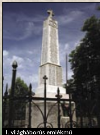
I. világháborús emlékmű