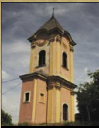
Szalók barokk harangtornya

Egerszalók Egertől 6 km-re nyugatra a Mátra és a Bükk-hegység között a Laskó-patak völgyében fekszik. A település már a honfoglalás óta lakott, a Szalók nemzetség ősi birtoka volt. Első okleveles említése 1248-ban történik, „terra-Zolouk” névalakban. A XVI. század elején Egerszalók legnagyobb része az egri káptalan birtokába került. Eger 1552. évi ostroma idején a törökök elpusztították, de rövidesen újra benépesült. 1586-ban a török a káptalan jobbágyaitól, a Belényi és Szalóky köznemes családok jobbágyaitól is súlyos fejadót, illetve bordézmát szedett, ennek folytán a falu egyre inkább elnéptelenedett. 1687-ben, Eger visszavétele után, a szalóki jobbágyok a szabad királyi városi rangra emelt Eger városába költöztek, hogy ott az adóterhektől mentesüljenek, de az uralkodó parancsára a várkatonák az ott összegyűlő jobbágyokat kiűzték és visszavitték földesuraik birtokára. A falu így 1694 körül visszakapta a lakóinak egy részét, de csak egy évtizedre, mert a kuruc időkben újra elnéptelenedett. A káptalan 1731. június 4-én kiadott telepítési szerződésével 35 sváb és német jobbágy családot telepített Szalókra. A XVIII. század közepétől magyar jobbágyok tömegesen költöztek ide, a falu népe előbb kétnyelvű, később magyarrá lett.