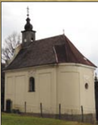
Kaplica rzymsko-katolicka w zamku