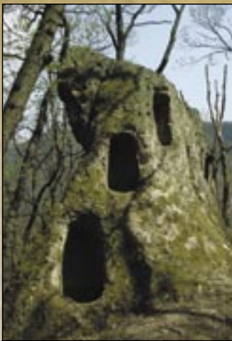
Duży Stożek Baba (Nagy-Bábaszék)