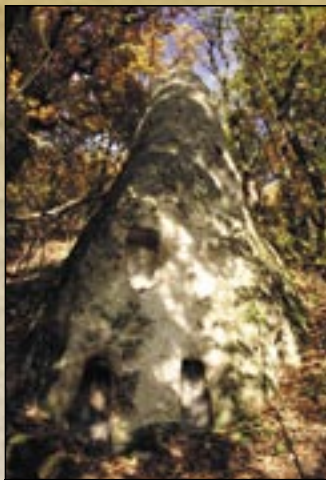
i kamienne ule Doliny Furgál

zniszczone. Duży Stożek (Nagykúp) i znajdującego się od niego na wschodzie Małego Stożka (Kiskúp) z 5 niszami razem z przylegającym terenem w roku 1960 ogłoszono obszarem podlegającym ochronie przyrody. Ze szczytu Duży Stożek (Nagykúp) otwiera się przed nami ładna panorama na Dolinę Pastucha (Csordás-völgy), której w wschodniej bocznej malutkiej dolinie również są kamienne ule. Najbardziej monumentalny jest pierwszy stożek grupy składającej się z pięciu skał. Na jego bardzo popękanej, szybko niszczącej powierzchni stoi w rzędzie 16 sztuk większych nisz.