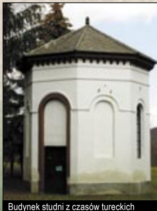
Budynek studni z czasów tureckich

zdobowali, ale nieprzerwanie w tym czasie utrzymać jeszcze nie mogli. Turcy zburzyli wieś zupełnie przed oblężeniem zamku. W roku 1596 po upadku Egeru straż zamku uciekła i tak Turcy bez walki zajęli zamek. Odziały cesarskie wyzwoliły go oblężeniem w roku 1687. Zamek odnowiono w roku 1697, tutaj kurucowie trzymali w niewoli egerskiego biskupa Telekessy'ego György w roku 1703. (Kurucowie to uczestnicy antyfeudalnych i wyzwolenieczych powstań chłopskich na Węgrzech.) Zamek został zniszczony prawdopodobnie podczas walk wolnościowych Rákóczi'ego. Dziś możemy zobaczyć tylko niewielkie resztki murów kamiennych i ślady szańców, które są pod ochroną zabytków. W XVIII wieku zamek dostał się w ręce rodziny L'Huilliere (rodzina pochodzenia francuskiego), która z kamieni zamku u podnóża Góry Zamku (Várhegy) wybudowała w latach 1780 pałac i w 1788 kaplicę. Ciekawostką pałacu jest to, że Munkácsy Mihály (najslawniejszy węgierski malarz) tutaj spędził część swojego dzieciństwa. Niestety z dawnego pałacu pozostały tylko ruiny. Kaplicy rzymsko-katolickiej będącej pod