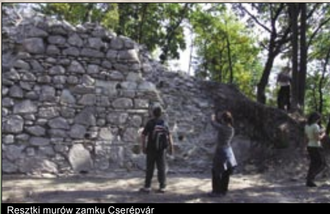
Resztki murów zamku Cserépvár