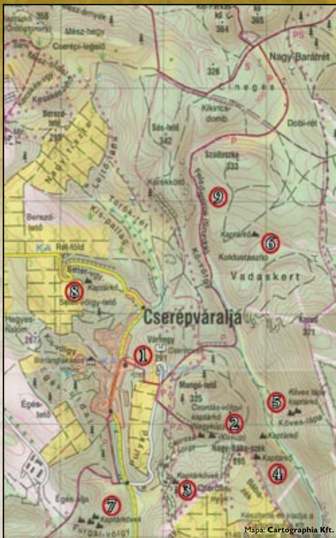
Mapa: Cartographia Kft.

Urząd Burmistrza; Adres: Cserépváralfa, Alkotmány út 52. Tel./fax: +36 49/423-893 • www.cserepvaralja.hu