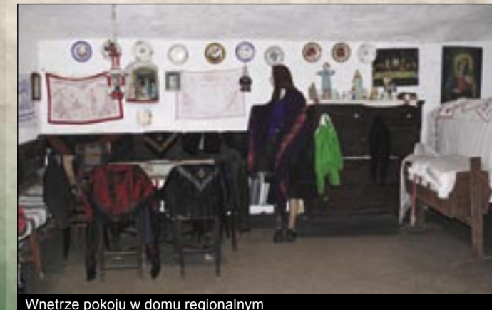
Wnętrze pokoju w domu regionalnym

Na granicy wioski w 10 miejscach znamy 20 kamiennych uli, w których łącznie jest policzone 132 nisze. Większość kamiennych uli ma kształt stożka, między nimi są i o okazałym rozmiarze. Z południowej strony Szczytu Mangó (Mangó-tető) wznoszący się Duży Stożek (Nagykúp) jest najbardziej znanym kamiennym ulem, którego starsi mieszkańcy wspominają również pod nazwą Wieża Diabła (Ördögtorony). Po stronie Szczytu Mangó (Mangó-tető) pod głęboką drogą tufy riolitowej ze stromego zbocza wznosi się 16,2 metrów wysoki stożek z tufy. Na jego bocznej stronie znajduje się 25 nisz, które są mocno