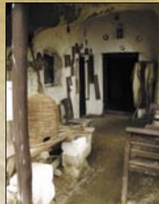
Dom regionalny – jaskinia mieszkalna

ochroną zabytków wybudowanej w stylu prostego rokoka dzisiaj już nie używają, msze odprawiane są w nowoczesnym kościele.