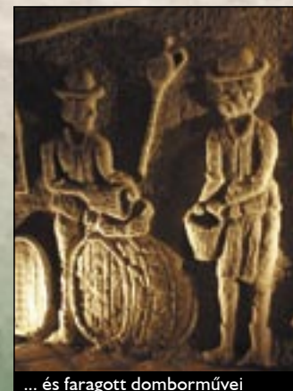
... és faragott domborművei

A községben mintegy 30 darab, a XX. sz. első felében kőből épült helyi védelem alatt álló parasztház található. Ezek egyike a Községi Emlékház , a Petőfi út 39. szám alatt, melyben régi fényképekből és használati tárgyakkal álló kiállítás tekinthető meg.