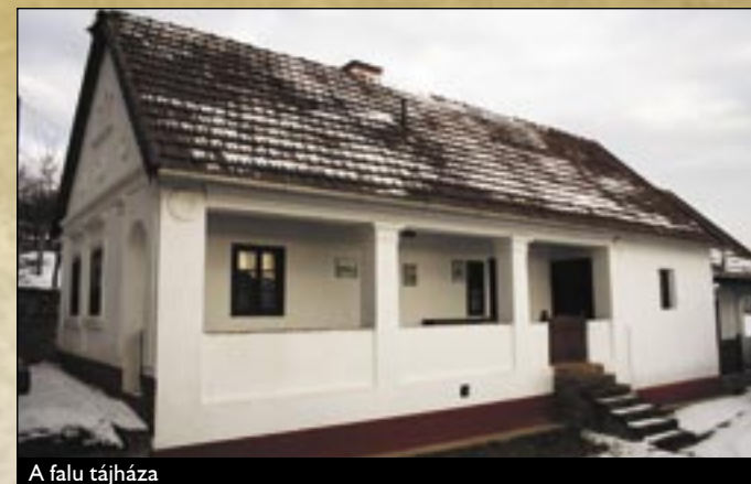
A falu tájháza

A község felett emelkedő Hódos-hegy ormára egy különös természeti képződmény, a Patkó-sziklák vonzzák tekintetünket. A mintegy 100 méter átmérőjű körbe foglalható sziklás képződmény a népi legenda szerint Szent László király lova patkójának a nyomát őrzi.