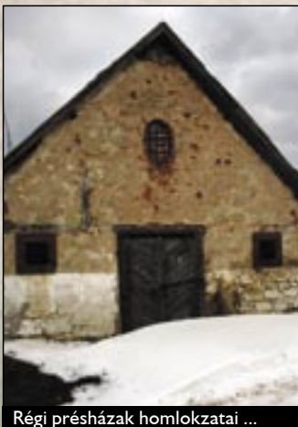
Régi présházak homlokzatai ...

A község református temploma 1828-ban épült. Imaházát 1825–28 között építették, a tornyot pedig 1884-ben emelték. A templom padozatát holland egyházi támogatással 1997-ben újjították fel.