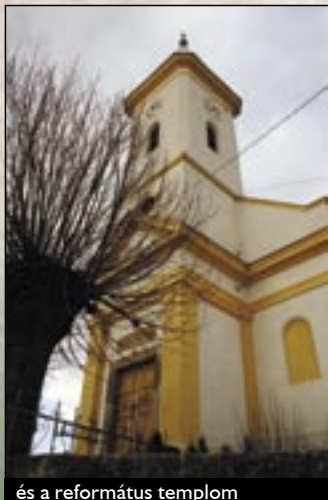
és a református templom