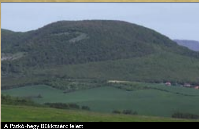
A Patkó-hegy Bükkzsérc felett

Bükkzsérc Egertől 25 km-re a Bükki Nemzeti Park déli határára mentén a Cseresznyés-patak partjait övezve és részben a környező domboldalakra is felkapaszkodva, mintegy 2 km hosszú völgyben helyezkedik el. Első írásos említése 1248-ban - IV. Béla király oklevélében - Serch névalakban történt. Ekkor az egri püspökség birtoka volt. A huszita mozgalom idején a környék bázisa, a török időkben hódoltság terület volt. A település lakosság számára a törökök kiűzése után egy 1695-ben készült összeírásból következtethetünk első alkalommal. Ekkor 20 db, többségében pusztult házat jegyeztek fel, ami mintegy 100-120 lakost fogadhatott be. Az 1786. évben megtartott első hivatalos népszámláláskor 631 lakost írtak össze a településen. Ez a szám fokozatos gyarapodás-