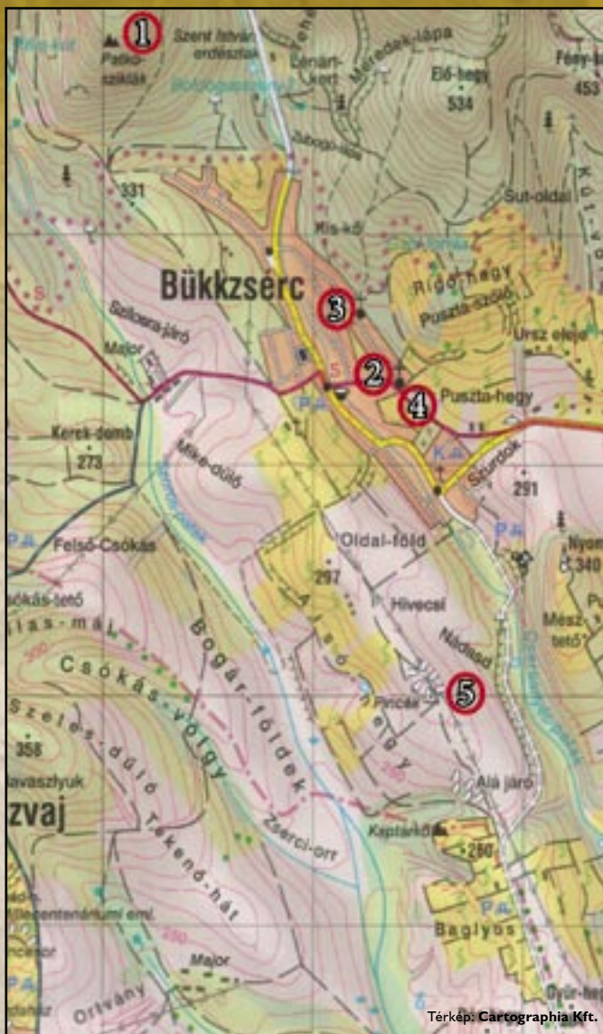
Térkép: Cartographia Kft.

Polgármesteri Hivatal Bükkzsérc, Petőfi út 4. Tel.: 49/523-011 • www.bukkszerc.hu