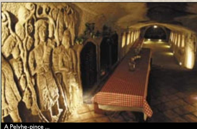
A Pelyhe-pince ...

Az itt élők hagyományosan a Bükk erdeiből éltek: az erdei mesterségek közül talán a legjelentősebb a mészégetés, illetve az égetett mész fuvarozása volt, amely során meszes-szekereikkel bejárták az Alföld falvait. A falut ölelő hegyek déli lankáin kiegészítő foglalkozásként szőlőt termesztettek és borászkodtak - mely foglalkozás az utóbbi időkben szerencsésen kezd újraéledni - és a gyönyörű természeti tájak mellett idegenforgalmi vonzerőként jelenik meg a falu életében.