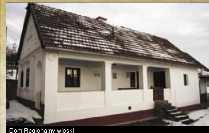
Dom Regionalny wioski

Jedną dziwną naturalną formacją (Skały Podkowa - Patkó-szklák) przyciąga nasze spojrzenie na szczyt góry Hódos wznoszącej się nad wioską. Według legendy ludowej ta skalna formacja znajdująca się w kole o średnicy 100 m. zachowuje ślady podkowy konia króla Św. Władysława.