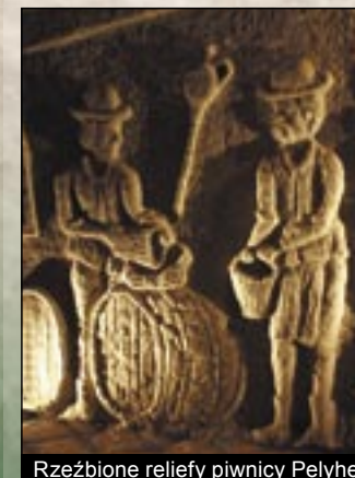
Rzeźbione reliefy piwnicy Pelyhe

W osadzie znajduje się mniej więcej 30 chłopskich domów będących pod miejscową ochroną zbudowanych z kamienia w pierwszej połowie XX wieku. Z tych domów jeden jest Domem Pamiątkowym Wioski przy ulicy Petőfi'ego pod num. 39, w którym można oglądać wystawę składającą się ze starych zdjęć i używanych przedmiotów.