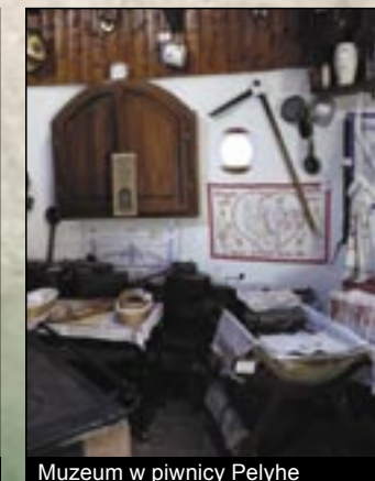
Muzeum w piwnicy Pelyhe