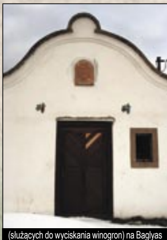
(służących do wyciskania winogron) na Baglyas

Punkt informacyjny pod nazwą „Bukkaljai Kő-út” (Droga Kamienia u podnóża Gór Bukowych) – Eger, w Fellner-tömbelső (w podwórzu bloku Fellner)