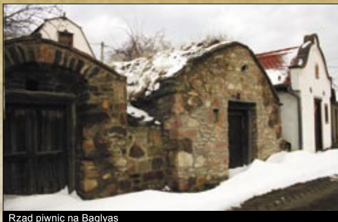
Rząd piwnic na Baglyas

ba stopniowo wzrastała i tak w roku 1941 kiedy odbywał się spis ludności już wzrosła do 1743 osób. W historii osady była to najwyższa liczba mieszkańców. II wojna światowa i po tym następnym dekadzie lat przyniosły radykalne zmiany we wzroście liczby ludności osady. Zaczął się proces niżu demograficznego, które niestety trwa do dziś.