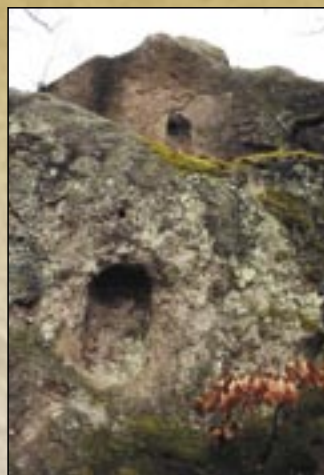
Kamienne ule w Dolinie Świętej (Szent-völgy)

Na granicy osady, drogą prowadzącą do Almáru o czerwonym znaku turystycznym, 20 minutowym spacerem od osady do jeziora bagiennego pokrytego torfowcem, które w roku 1978 zostało uznane za rezerwat. Od Jeziora Wielkiego (Nagy-tó) mniej więcej 100 metrów, na zboczu Góry Jezioro (Tó-hegy), na wysokości 280 m nad poziomem morza znajduje się bagno pokryte torfowcem, które powstało po obsunięciu się strony góry. Tutaj znajdujące się rośliny należą do rzadkich gatunków flory na Węgrzech. Miedzy różnymi rodzajami torfowców są najładniejsze i najobszerniejsze berzedt torfowiec, skrzyp błotny oraz bobrek trójlistkowy, który kwitnie na początku maja i jest pod ochroną. Na Węgrzech tylko tutaj można jeszcze spotkać złotozłtą tojeść bukietową i wełniankę delikatną.