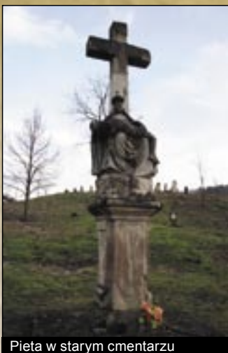
Pieta w starym cmentarzu

jest własnością prywatną i funkcjonuje dziś jako hotel.