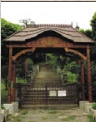
Rzeźbiona brama u podgórza kościoła