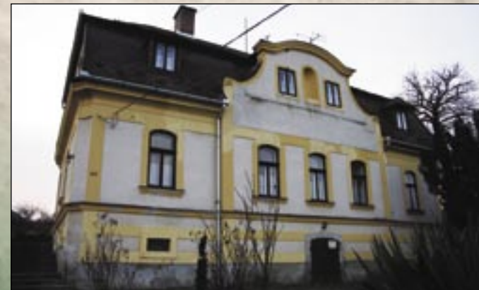
Fasada pałacu Brezovai'ego