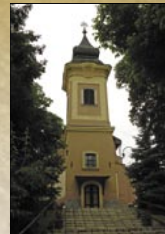
Kościół rzymsko-katolicki w wiosce Egerszólát